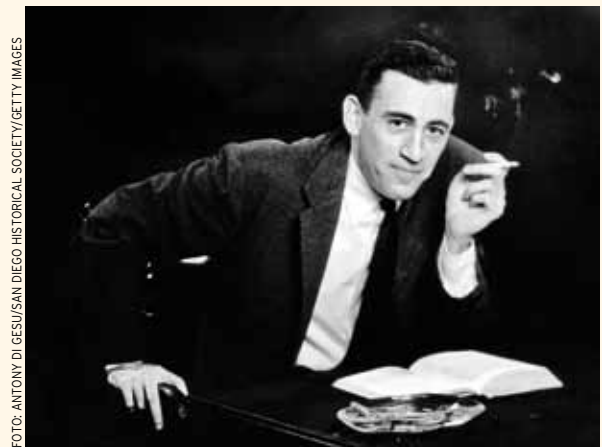
JEROME D. SALINGER: Der vielleicht berühmteste Eremit der Literatur des 20. Jahrhunderts. SEITE 18