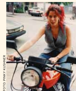
RACHEL KUSHNER wurde mit ihren ersten beiden Romanen für den National Book Award nominiert. Das ist vor ihr noch niemandem gelungen. Soeben ist der erste auf Deutsch erschienen. SEITE 16